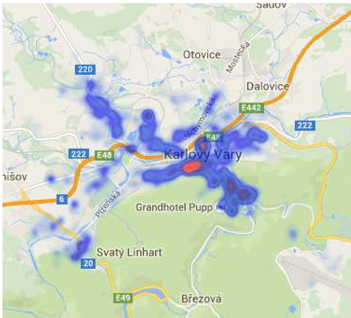
Obrázek 4: Rozložení podnikatelských aktivit na území města Karlovy Vary, vyšší hustotě subjektů v území odpovídá tmavší zbarvení

V rámci projektu budou osloveny 2 kategorie podnikatelských subjektů – malé a střední podniky, velké podniky.